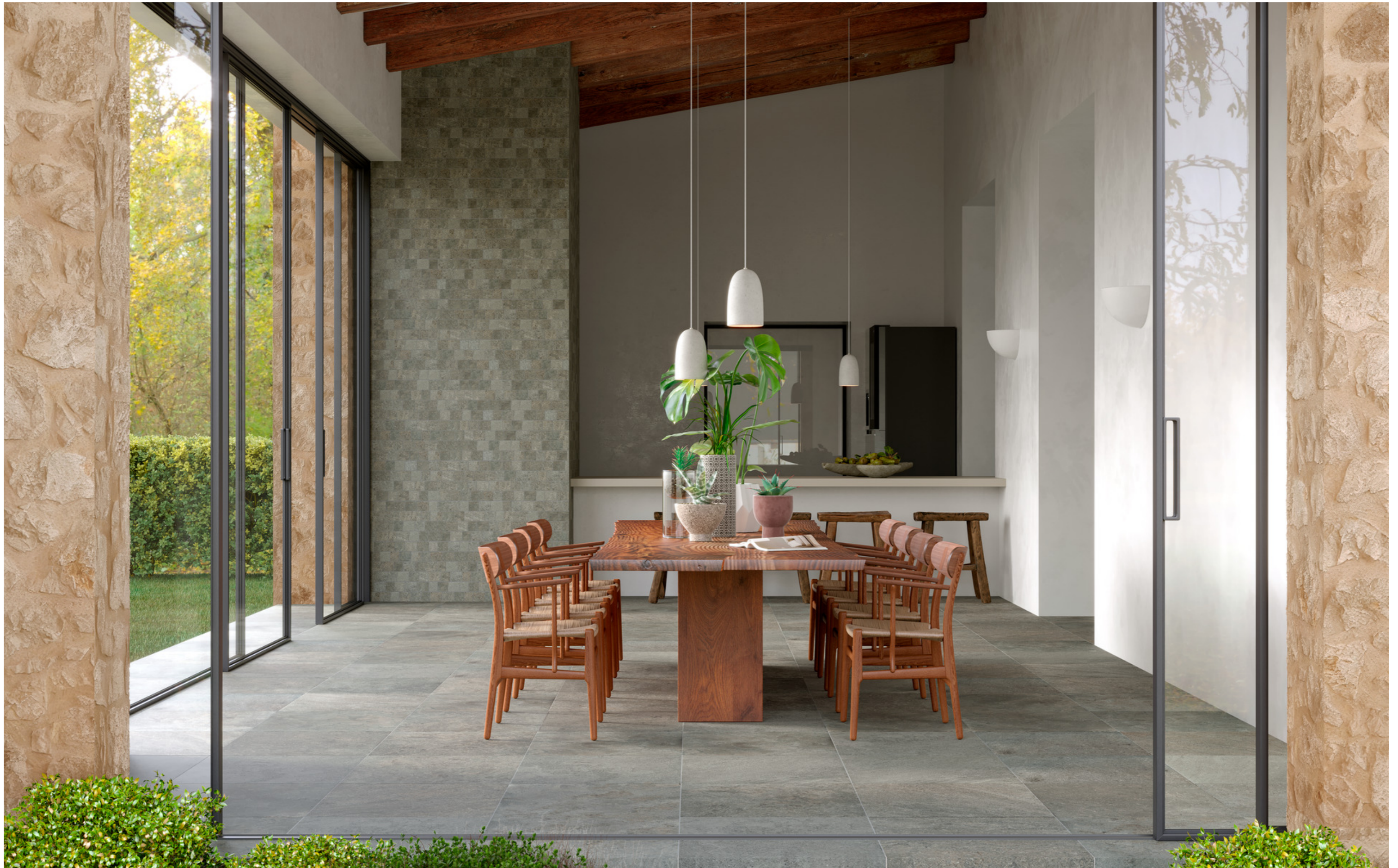
MAQZ Uniche Ostuni Mosaico Spaccatella Str 28x59cm MAPZ Uniche Avignone Stepwise Rt 60x60cm