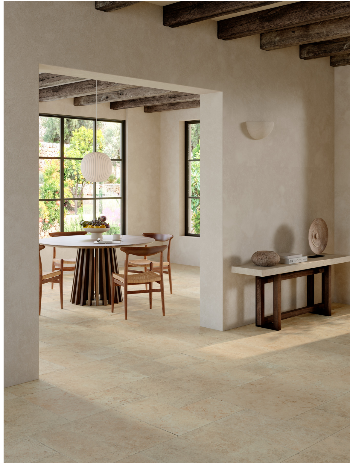
MAVD Uniche Ostuni Stepwise Rt 30x30cm MAQ8 Uniche Ostuni Stepwise Rt 30x60cm MAPY Uniche Ostuni Stepwise Rt 60x60cm