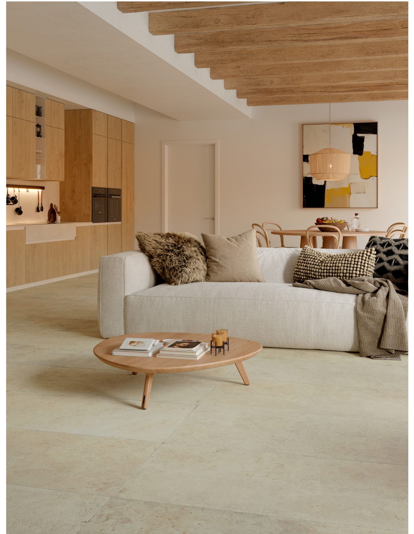
MAZL Uniche Ostuni Velvet Rt 60x120cm