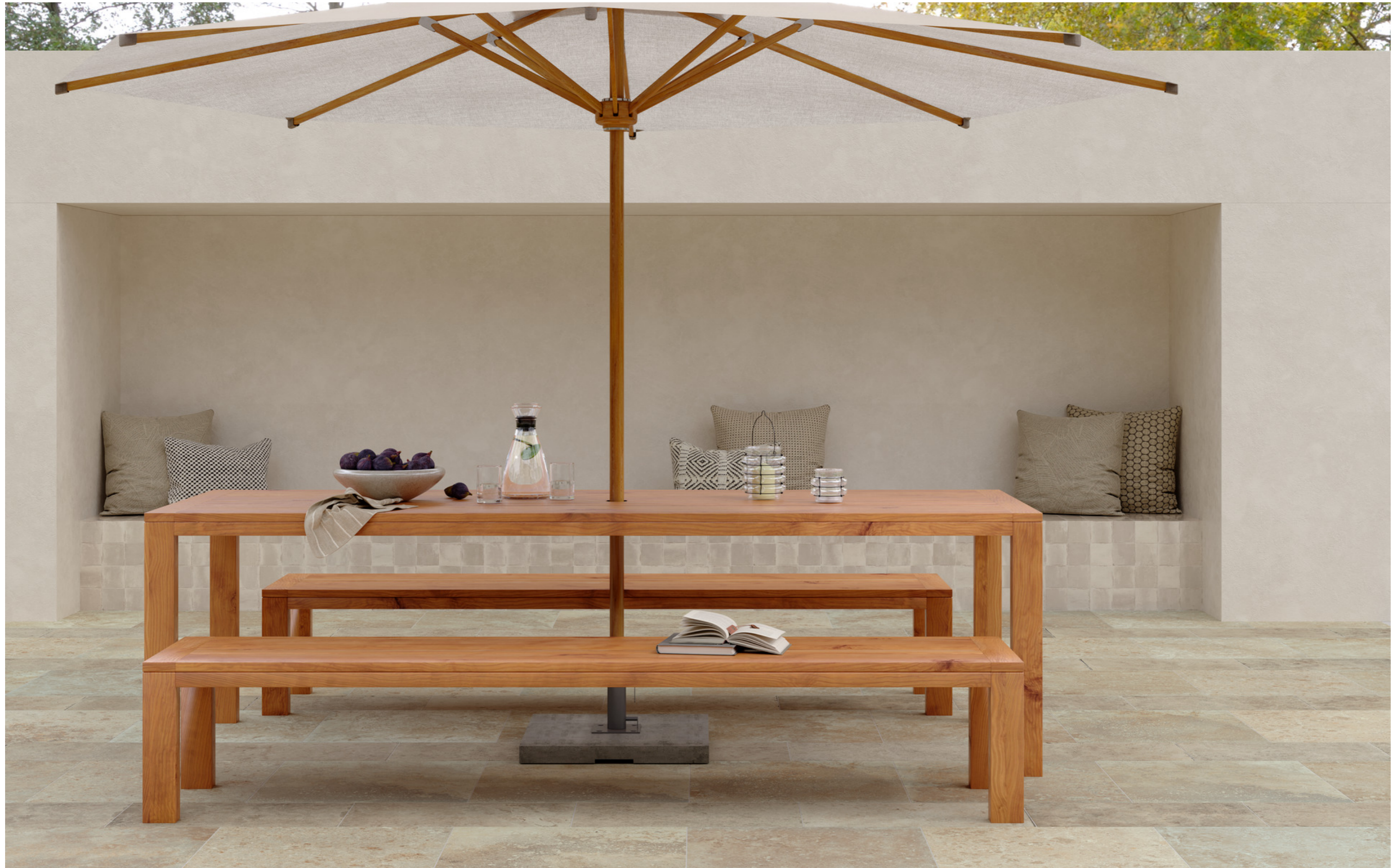
MAQD Uniche Cadiz Structured_Surface Rt 30x60cm MAQ2 Uniche Cadiz Structured_Surface Rt 60x60cm