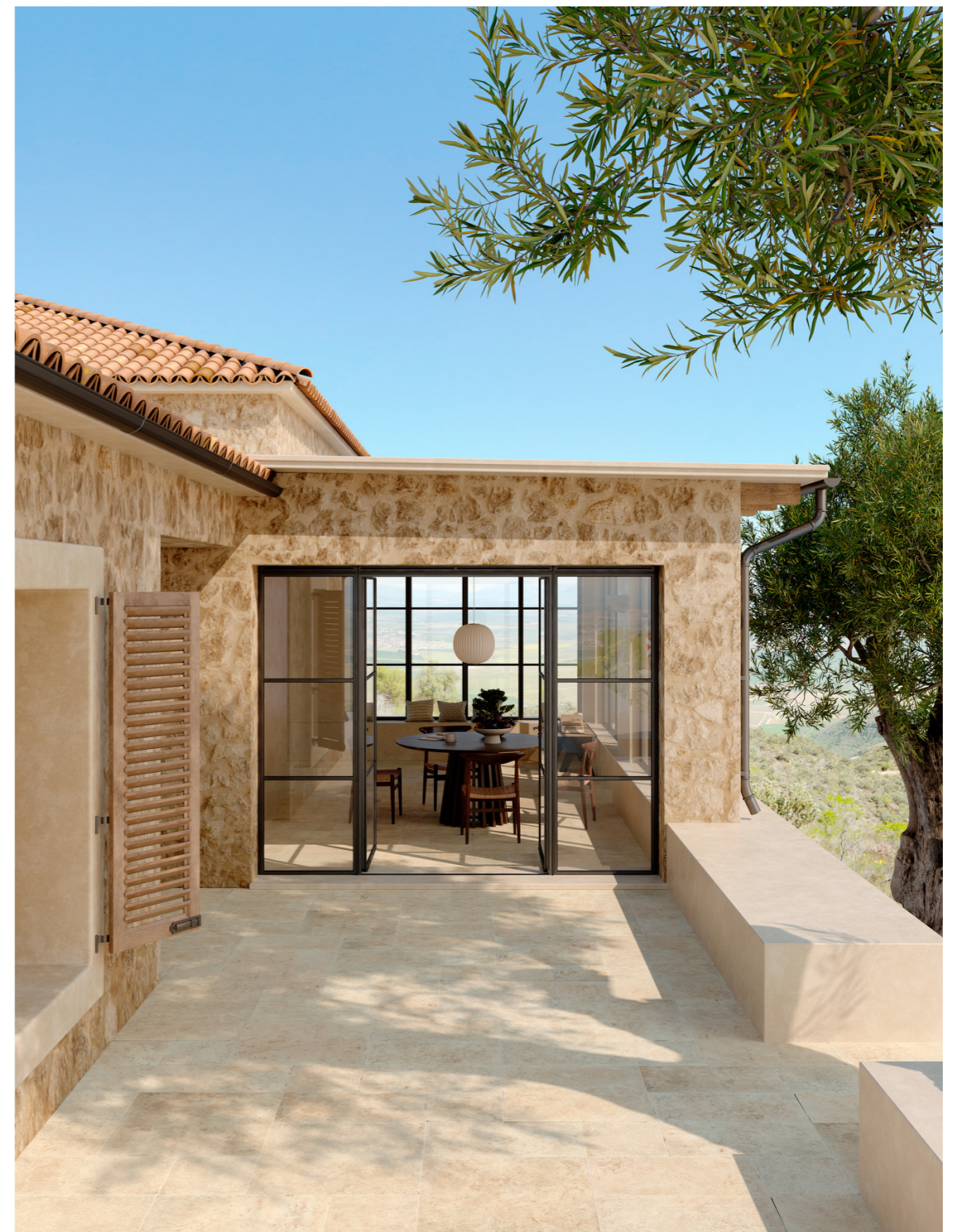
MAY4 Uniche Ostuni Structured_Surface Rt 30x30cm MAQE Uniche Ostuni Structured_Surface Rt 30x60cm MAQ3 Uniche Ostuni Structured_Surface Rt 60x60cm