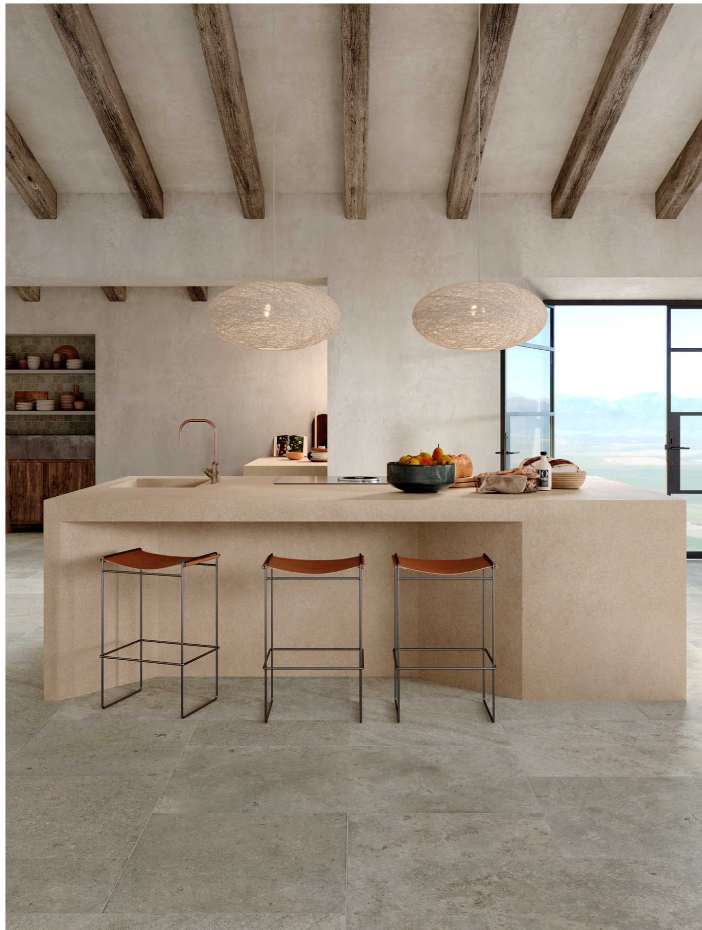
MAQX Uniche Avignone Mosaico Spaccatella 28x59cm MAQ9 Uniche Avignone Stepwise Rt 30x60cm MAPZ Uniche Avignone Stepwise Rt 60x60cm MAEY Uniche Avignone Rt 60x120cm