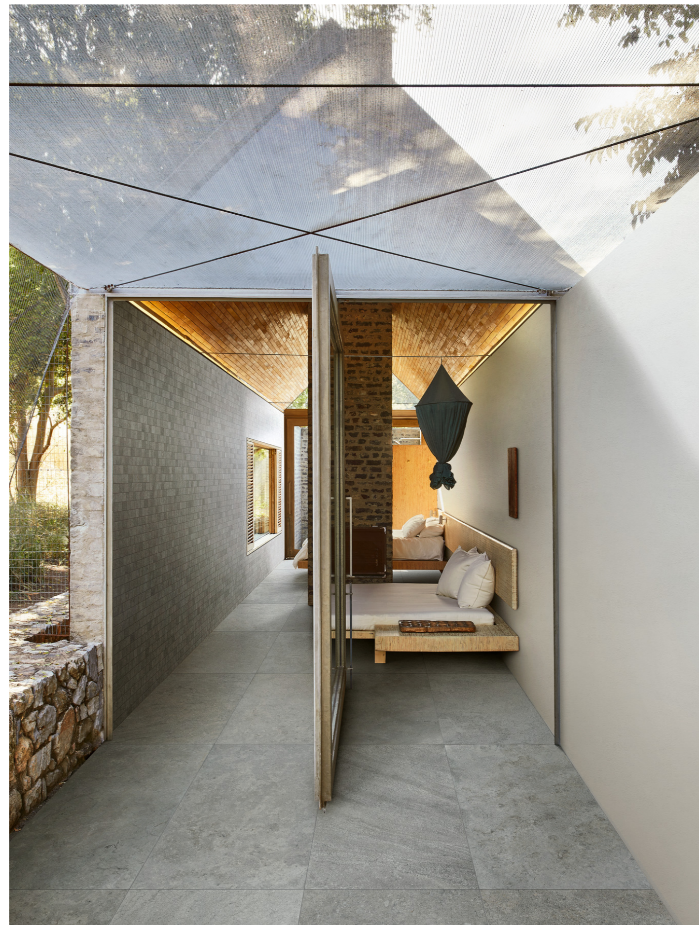
MAQX Uniche Avignone Mosaico Spaccatella 28x59cm MAHG Uniche Avignone Strutturato Rt 60x120cm MAEY Uniche Avignone Rt 60x120cm