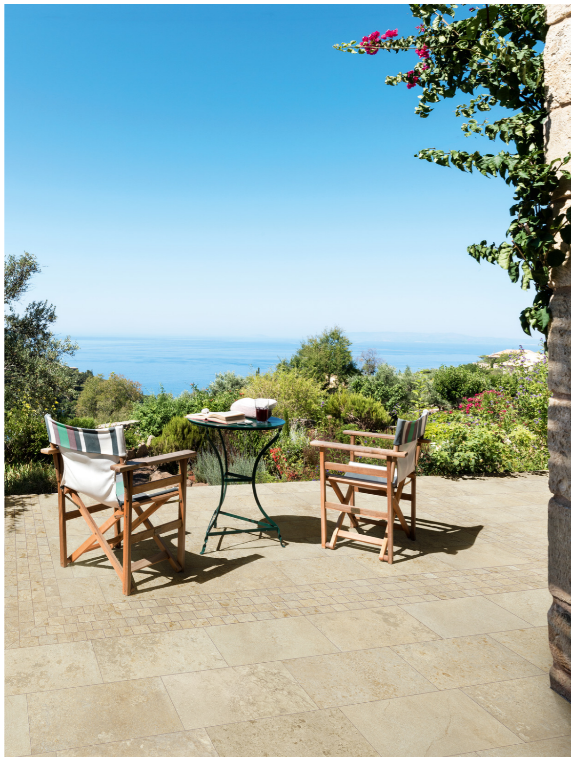
MAR1 Uniche Arles Mosaico Spaccatella Str 28x59cm MAQC Uniche Arles Structured_Surface Rt 30x60cm