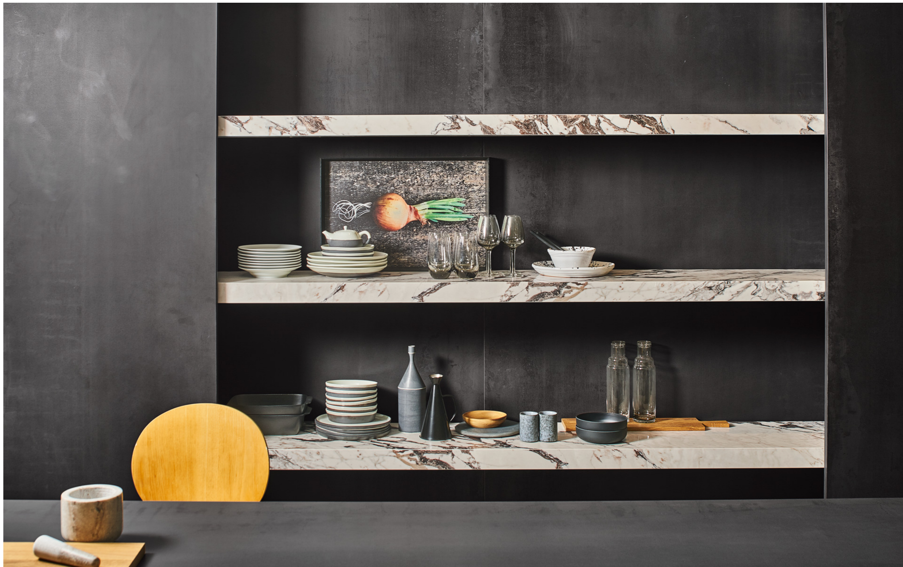
M11C Grande Metal Look Iron Dark Metal Rt 6Mm 160x320cm MOZH Grande Marble Look Capraia Bookmatch A Lux 12Mm 162x324cm