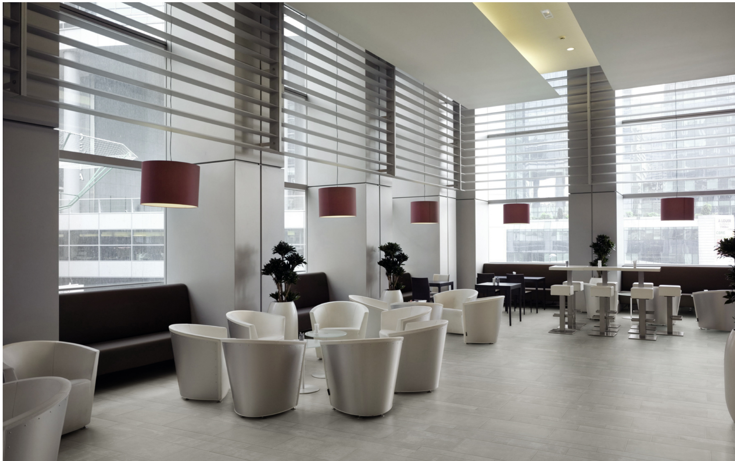
M9Z5 Neutro Grigio Medio 10X60 10x60cm M83G Neutro Grigio Medio 30x60cm